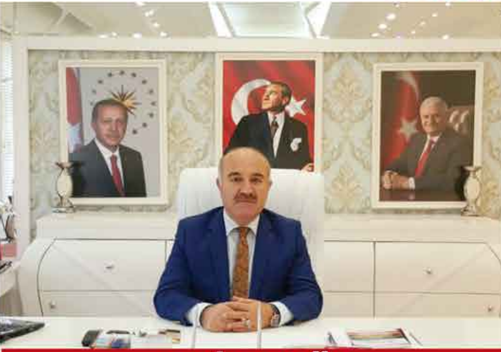
ŞERİF AYGÜN Köse Belediye Başkanı

“Anayasa değişikliği ülke yönetiminde zaman ekonomisi sağlayacak. Yani işler daha kısa sürede halledilecek. Bürokrasiyle siyaset arasındaki ayrışma ortadan kalkacak. Sistem didişmeyi, çift başlılığı ortadan kaldırarak kararların daha hızlı verilmesini sağlayacak.