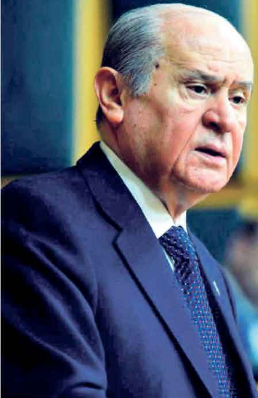
Devlet Bahçeli MHP Genel Başkanı

“Bundan sonrası için de söz ve karar, egemenliğin yegâne sahibi olan büyük Türk milletindedir. Aziz milletimiz TBMM’de kabul edilen anayasa değişikliğiyle ilgili iradesini gösterip hükmünü verecek ve bu herkes için bağlayıcı olup kesinlik içerecektir.”